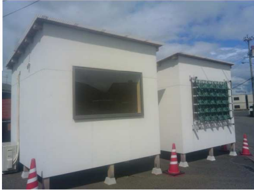
西向 設置 8.35㎡ 2.5坪